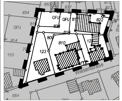
Gemarkung Radevormwald, Flur 28 M. 1:500

Dieser Plan ist Bestandteil der Satzung über die vollständige Aufhebung der Satzung der Stadt Radevormwald über die förmliche Festlegung des städtebaulichen Entwicklungsbereiches Nordstadt III (Entwicklungssatzung) vom 10.12.1993 in der Fassung der 1. und 2. Änderung vom 13.10.1994 und der Teilaufhebung vom 08.08.2006, die der Rat der Stadt Radevormwald aufgrund des § 169 (1) Nr. 8 i.V.m. § 162 BauGB am 13.03.2012 beschlossen hat. Radevormwald, den Der Bürgermeister